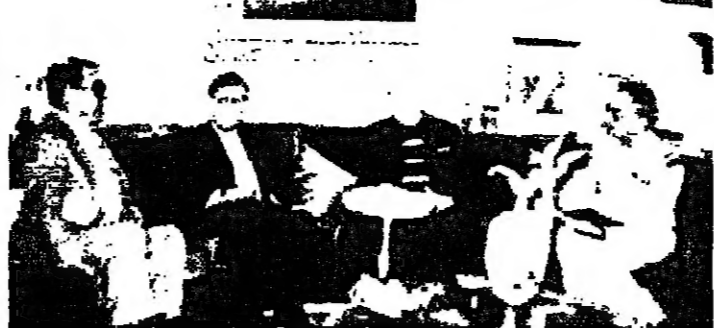
الرئيس كرامي يجتمع بالبعيد قسيس بحضور العديد من أعضاء المجلس التشريعي